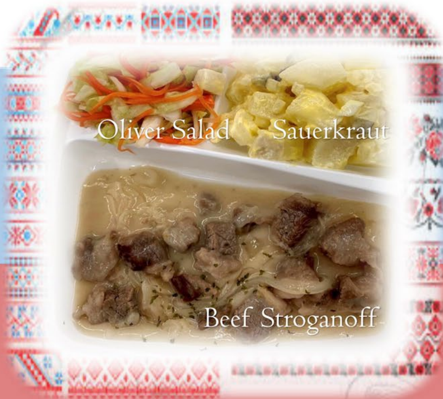
Oliver Salad Sauerkraut